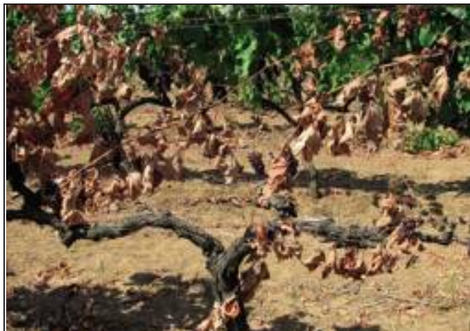
[ Disseccamenti. Forma apoplettica su vite di Negroamaro.