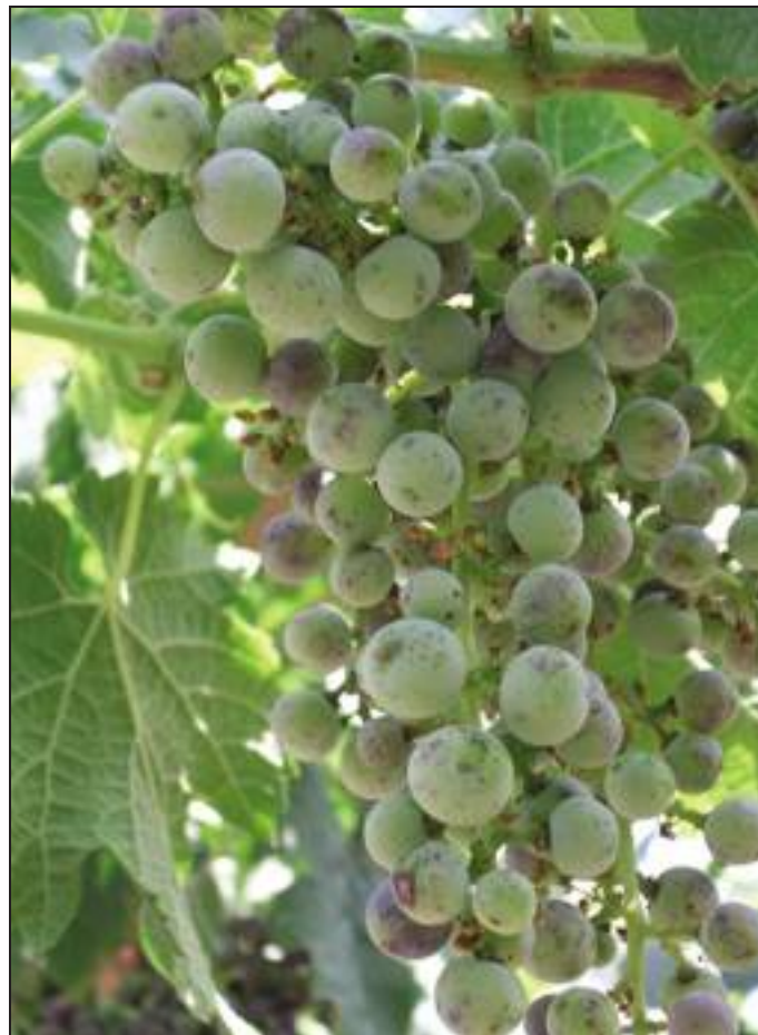
[ Picchiettature necrotiche. Sintomi di esca su grappoli.

vivaio, o penetrino attraverso le ferite da innesto». Anche i tagli di potatura e le forme di allevamento influenzano infatti la malattia: in seguito alle operazioni di moltiplicazione per talea effettuate in vivaio, se non si è provveduto alla protezione delle ferite da taglio, possono verificarsi, in condizioni di temperatura mite e umidità relativa elevata, fenomeni anomali di gommosi e resinosi conseguenti alla colonizzazione da parte di microrganismi saprofiti o parassiti; inoltre le forme di allevamento che prevedono grandi e frequenti tagli di potatura favoriscono la diffusione del mal dell'esca.