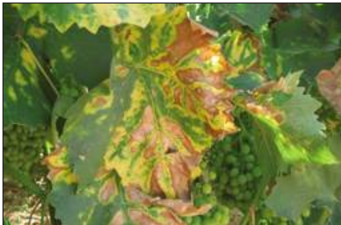
[ Foglie "tigrate". Sintomi di esca su Sangiovese e Chardonnay.